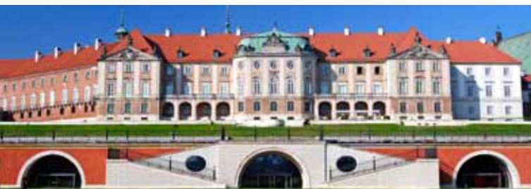
Королевский замок Plac Zamkowy 4, тел. 22 35 55 170, www.zamek-krolewski.com.pl