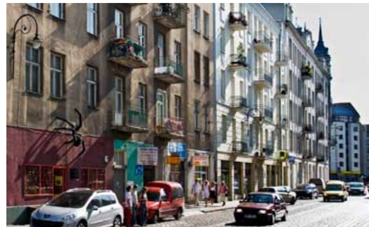
Прага ul. Ząbkowska

Прага на протяжении столетий была самостоятельным городом, который был формально присоединен к Варшаве лишь в конце XVIII в. Многие годы это была второстепенная часть города, уцелевшая от военных разрушений. Сегодня это удивительный район, в котором располагаются ателье художников, галереи и альтернативные театры. Здесь открылись модные клубы, постиндустриальные объекты преобразованы в культурные центры, кинотеатры, галереи и пабы. С другой стороны, именно в Праге можно встретить множество улиц с полностью сохранившейся старой застройкой, найти старые фонари и довоенные моетовые. Одну из главных улиц Праги – улицу Зомбковску – многие считают «пражской старушкой». На этой улице расположена одна из бесспорных достопримечательностей города – Конесер . Это комплекс зданий из красного кирпича конца XIX в., в котором на протяжении более ста лет располагался ликёровоочный завод. Конесер является одним из наиболее ценных примеров индустриальной архитектуры. В настоящее время Конесер – это также современный культурный центр.