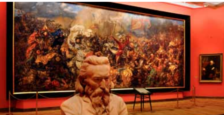
Национальный музей, Aleje Jerozolimskie 3 тел. 22 629 30 93, www.mnw.art.pl (по субботам вход бесплатный)

Национальный музей – это одно из важнейших культурных учреждений в стране и самый большой музей столицы. В семи постоянных галереях представлены, в частности, памятники раннехристианского искусства, скульптуры, монументальная живопись и изделия из золота со всех регионов, исторически связанных с Польшей в эпоху средневековья, а также произведения искусства, созданные в других важных центрах Европы – картины, скульптуры, художественные промыслы от средневековья до начала XX в. Главной достопримечательностью музея является огромное полотно кисти Яна Матейко (XIX в.- Ян Матейко – знаменитый польский живописец, автор исторических и батальных картин) – «Грюнвальдская битва» внушительным размером 426 × 987 см. В музее также проходят многочисленные временные выставки произведений искусства со всего мира. В крыле здания со стороны Вислы расположен Музей Польского Войска , где выставлена экспозиция, представляющая историю польского оружия со времен средневековья. На площади перед зданием музея можно увидеть тяжёлые орудия периода Первой и Второй мировой войны, в том числе танки, артиллерийские установки и вертолёты.