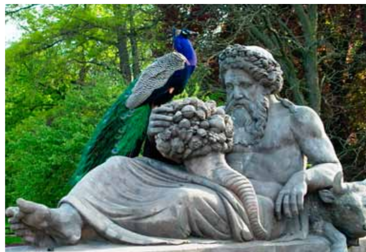
Королевские Лазенки дворцово-парковый ансамбль ул. Agrykoli 1, тел. 22 506 01 01, www.lazienki-krolewskie.pl

Лазенки - один из красивейших дворцово-парковых ансамблей в Европе, основанный в XVII в. польским королем Станиславом Августом. Когда-то на этом густо засаженном деревьями месте был зверинец - место, куда короли выезжали на охоту. Необычное название парка (с польского языка - «бани», «купели») связано с тем, что дворец был перестроен из бани. На территории Лазенок находится много исторических зданий, среди которых самое важное - летняя королевская резиденция - Дворец на острове, где проходили приемы и знаменитые обеды по четвергам. Возле дворца расположен Театр на острове. В парке стоит также отыскать Охотничий дворец, где жили королевские придворные, оранжерею, кордегардию, Белый дом и многое другое. Королевские Лазенки - это место проведения многочисленных культурных, научных и развлекательных мероприятий, а также любимое место для прогулок варшавян. В парке запрещено ездить на роликах, скейтбордах и велосипедах.