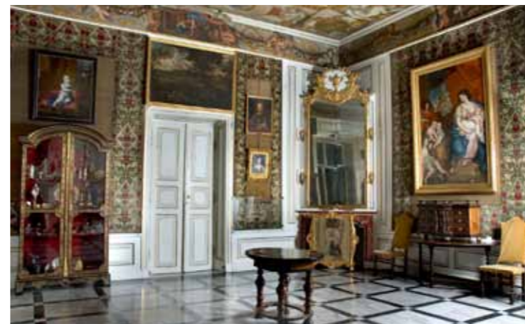
Дворцово-парковый ансамбль в Вилануве ул. Ст. К. Potockiego 10/16, тел. 22 842 07 95, www.wilanow-palac.art.pl

Виланувский дворец - это летняя королевская резиденция Яна III Собеского, а затем Августа II, а также самых именитых магнатских родов. Название резиденции, как и всей территории, происходит от словосочетания Villa Nova (новый город). Такое название дал своим землям Собеский, покупая их в XVII в. под строительство дворца. Внушительное строение соединило в себе элементы дворянской усадьбы, итальянской загородной виллы и дворца в стиле Людовика XIV, французского Короля-Солнце. Это один из красивейших памятников европейского барокко и величия Речи Посполитой. Стоит вспомнить, что в 1805 г. Станислав Потоцкий (тогдашний хозяин Виланова) предоставил для доступа широкой общественности свою коллекцию произведений искусства, собранную в Виланувском дворце, создав таким образом, один из первых музеев Польши. Между дворцом и Виланувским озером раскинулся двухъярусный итальянский парк. В южной части находится романтический сквер в английском стиле. Дворцово-парковый ансамбль в Вилануве - это место проведения важных культурных мероприятий и концертов. На месте, где раньше находился манаж, расположился Музей плаката.