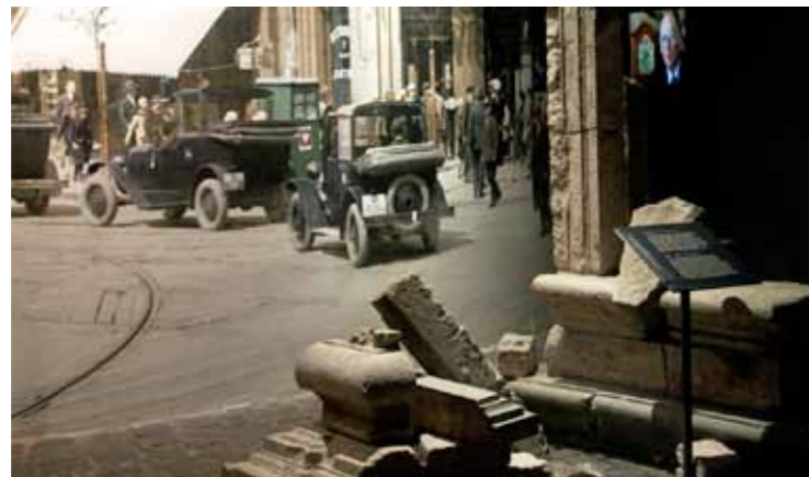
Музей Варшавского восстания ul. Grzybowska 79, тел. 22 539 79 05, www.1944.pl (вс. – вход бесплатный)

Музей Варшавского восстания , открытый в 60-ую годовщину этого события, является одним из наиболее часто посещаемых мест столицы. Музей расположен в здании бывшего трамвайного депо на улице Гжибовской 79 (ul. Grzybowska 79). Кроме главного здания музей охватывает Парк свободы, Стены памяти и блиндаж. Современная экспозиция передает атмосферу того времени, пытается воссоздать дух восставшей Варшавы, показать не только военные события 63-х дней борьбы, но и повседневную жизнь гражданского населения. Одной из многочисленных достопримечательностей музея является копия бомбардировщика В-24 «Либейретор». Музей ведёт разностороннюю воспитательно-культурную деятельность: организует уроки и мастерские для молодёжи, используя контакт с подлинными экспонатами, создает интересные дидактические игры, а также приглашает на лекции, фильмы, концерты и театральные спектакли. Наиболее мероприятия происходят во время так называемой «недели по случаю годовщины», которая включает дату 1 августа – день начала Варшавского восстания.