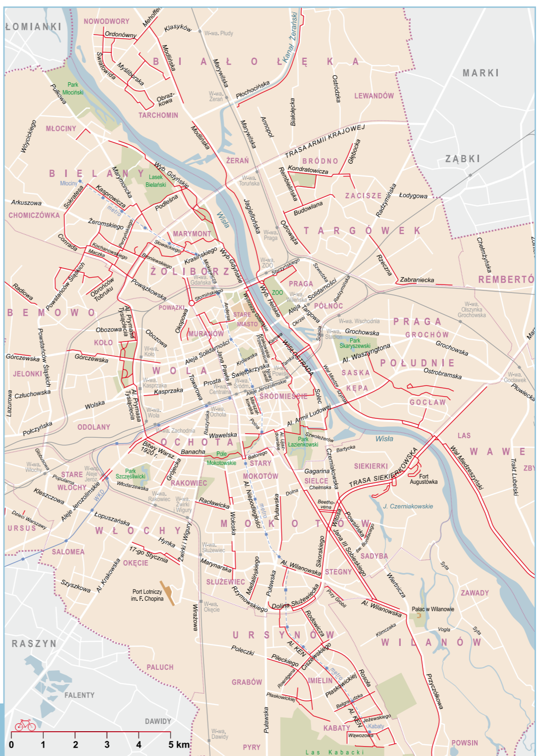
mapa ścieżek rowerowych w Warszawie

naria i wykłady poświęcone bieganiu, targi sportowe oraz wiele innych atrakcji.