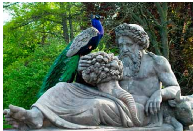
Zespół pałacowo-ogrodowy Łazienki Królewskie ul. Agrykoli 1, tel. 22 506 01 01, www.lazienki-krolewskie.pl

Łazienki to jeden z najpiękniejszych zespołów pałacowo-ogrodowych w Europie, założony w XVII w. przez króla Polski Stanisława Augusta. Niegdyś na tym gęsto zadrzewionym terenie był zwierzyńiec – miejsce, gdzie królowie urządzali polowania. Zaskakująca nazwa Parku pochodzi od łaźni, przebudowanej na pałac. Na terenie Łazienek znajduje się wiele zabytkowych budowli, z których najważniejsza to letnia rezydencja królewska – Pałac na Wyspie, gdzie odbywały się przyjęcia i słynne obiady czwartkowe. Obok Pałacu znajduje się Teatr na Wyspie. W parku warto odszukać także Pałac Myślewicki, gdzie mieszkali królewscy dworzanie, Pomarańczarnię, Kordegardę oraz Biały Domek. Łazienki Królewskie to miejsce licznych wydarzeń o charakterze kulturalnym, naukowym i rozrywkowym, a także ulubione miejsce spacerów Warszawiaków. W parku nie wolno jeździć na rolnikach, deskorolkach ani rowerach.