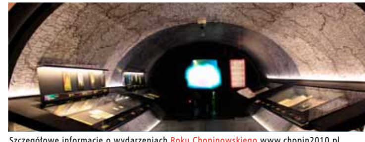
Szczegółowe informacje o wydarzeniach Roku Chopinowskiego www.chopin2010.pl

Fryderyk Chopin, co rzadko się podkreśla, spędził w Warszawie pierwsze 20 lat, a więc połowę swojego życia. Tu uczył się muzyki, zdobywał wiedzę, dawał pierwsze koncerty. W miejscach, szczególnie związanych z kompozytorem, umieszczono nie tylko tablice pamiątkowe, ale też multimedialne ławeczki, które po naciśnięciu guzika wygrywają melodie. Na każdej z nich umieszczono, dodatkowo, schematyczną trasę spaceru, „Śladami Chopina” oraz krótki opis miejsca. Dzięki znajdującym się w ławeczkach fotokodom można też ściągnąć, na swój telefon komórkowy aplikację z muzyką oraz informacjami o życiu i podróżach kompozytora. Wizytówką stolicy, jako miasta muzyki i Chopina, jest Muzeum Fryderyka Chopina , najnowocześniejsze muzeum biograficzne w Europie, będące jednocześnie największym na świecie zbiorem chopinianów. Mieści się ono w zabytkowym Zamku Ostrojskich. Kolekcja obejmuje m.in. rękopisy i druki muzyczne, korespondencję, autografy i notatki oraz przedmioty należące do kompozytora (np. fortepian, ale też spinki, kalendarzyki). Niezwykle cennymi eksponatami są maski pośmierne i odlew ręki kompozytora. Zwiedzający nie musi oglądać wnętrza według sztywno narzuconej trasy. Dzięki biletowi z chipem, sam decyduje o wyborze ścieżki zwiedzania, dostosowanej do indywidualnych zainteresowań, a multimedialne ekspozycje, dotykowe ekrany i instalacje dźwiękowe, a nawet zapachowe pozwalają na odbieranie wrażeń wszystkimi zmysłami. W Muzeum istnieje możliwość wysłuchania koncertów na żywo.