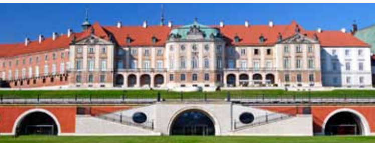
Zamek Królewski Plac Zamkowy 4, tel. 22 35 55 170, www.zamek-krolewski.com.pl