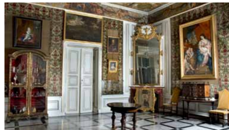
Zespół pałacowo-parkowy w Wilanowie ul. St. K. Potockiego 10/16, tel. 22 842 07 95, www.wilanow-palac.art.pl