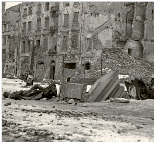
Roztrzaskana kolumna i posąg Zygmunta III Wazy leżące na bruku pl. Zamkowego. W tle zniszczone kamienice w zachodniej pierzei placu (Muzeum Powstania Warszawskiego. Fot. Eugeniusz Haneman)