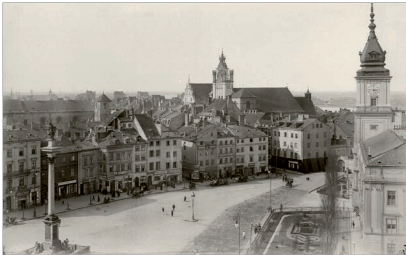
Plac Zamkowy (Archiwum m.st. Warszawy.)

Los Warszawy, nazywanej przed wojną „Paryżem Wschodu”, został przypieczętowany rozkazem wydanym przez Heinricha Himmlera, który brzmiał: „Każdego mieszkańca należy zabić, nie wolno brać żadnych jeńców, Warszawa ma być zrównana z ziemią i w ten sposób ma być stworzony zastraszający przykład dla całej Europy”.