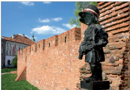
Pomnik Małego Powstańca