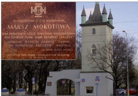
Wieża zegarowa gotyckiego domku przy ul. Puławskiej 59