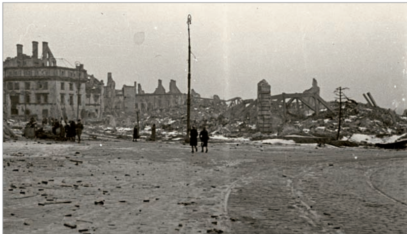
Plac Zamkowy, ujęcie od Krakowskiego Przedmieścia. Po prawej gruzy Zamku Królewskiego, po lewej zniszczona kamienica u zbiegu ze Świętojańską.

Stolica Polski została zniszczona w blisko 85%, a mieszkańcy wypędzeni do obozów przejściowych i jenieckich.