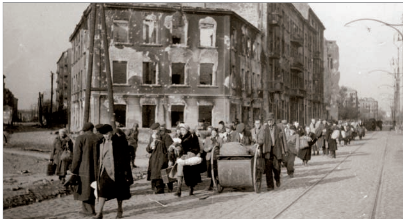
ul. Grójecka, Kapitulacja. Wyjście ludności cywilnej z miasta.

Stolica Polski została zniszczona w blisko 85%, a mieszkańcy wypędzeni do obozów przejściowych i jenieckich.