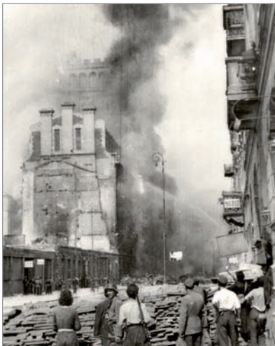
Plonący budynek PAST-y przy ulicy Zielnej 37/39 (Muzeum Powstania Warszawskiego. Fot. Eugeniusz Lokajski)