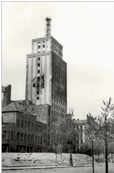
Gmach „Prudentialu” przy placu Napoleona 9 (Muzeum Powstania Warszawskiego. Fot. Eugeniusz Lokajski)