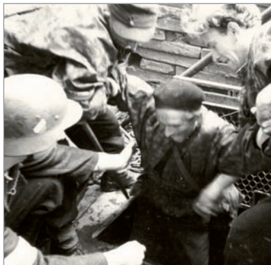
Wychodzenie z kanału powstańca ze Starówki na ul. Nowy Świat róg Wareckiej