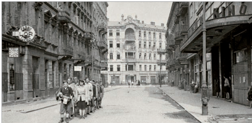
Grupa harcerzy na ul. Złotej. W tle zabudowa ul. Złotej w kierunku ul. Zgoda. Po prawej wejście do Kina „Palladium” w budynku Złota 7/9 (Muzeum Powstania Warszawskiego. Fot. Marian Grabski)

Palladium (ul. Złota 7/9) – kino otwarte w 1937 roku, przetrwało wojnę i pełniło swoją funkcję aż do roku 2000. W czasie okupacji Niemcy zmienili nazwę na „Helgoland”. Po przejęciu tego kina przez Powstańców, wyświetlano w nim powstańcze kroniki pt. „Warszawa Walczy”. Obecnie znajduje się tu klub muzyczny i teatr.