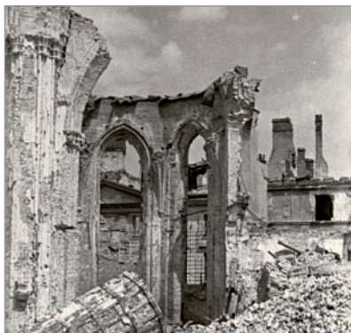
Ruiny katedry św. Jana – pozostałości prezbiterium. Ujęcie od Świętojańskiej. W tle szczyty kamienic na Kanonii.

Bazylika Archikatedralna pw. św. Jana Chrzciciela (ul. Świętojańska 8) – zacięte walki o katedrę trwały od 21 do 27 sierpnia. Nalot bombowy i zmasowany atak niemieckiej piechoty doprowadziły do kompletnego zniszczenia kościoła. W ścianę Katedry, od strony ul. Dziekanii, został wmurowany fragment gąsienicy wraz z informacją, że pochodzi ona z tzw. „goliata” (lekkie gąsienicowe transportery ładunku wybuchowego). Nie jest to jednak prawda. Gąsienica pochodzi prawdopodobnie z tzw. czołgu-pułapki, który eksplodował na ul. Kilińskiego 1.