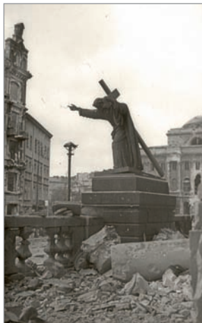
Krakowskie Przedmieście. Figura Chrystusa i leżące przy postumencie pozostałości kolumn.

Kolumna Zygmunta III Wazy (plac Zamkowy) – najstarszy i najwyższy świecki pomnik, wzniesiony w 1644 roku z inicjatywy Władysława IV na cześć Zygmunta III Wazy, jego ojca, który przeniósł stolicę z Krakowa do Warszawy. Trzysta lat później pomnik został roztrzaskany, podczas ataku niemieckiego na Stare Miasto. Pierwotny trzon kolumny pochodzący z XVII w. oraz ten zniszczony w Powstaniu leżą tuż obok Zamku Królewskiego.