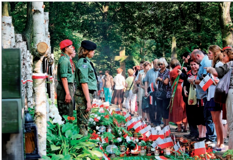
Cmentarz Wojskowy Powązki. Obchody 1 sierpnia

1 sierpnia – co roku Warszawa oddaje hołd Powstańcom. Na warszawskich ulicach powiewają flagi państwowe, w miejscach uświęconych krwią poległych i pomordowanych mieszkańców miasta płoną znicze. Na cmentarzu Powązki Wojskowe pod pomnikiem Gloria Victis przedstawiciele najwyższych władz państwowych, kombatanzi i mieszkańcy Stolicy składają kwiaty. O godz. 17.00 na jedną minutę zamiera ruch w mieście i wyją syreny. Na pl. Piłsudskiego warszawiacy wspólnie śpiewają powstańcze piosenki.