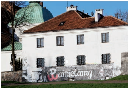
Mural. Kościół Nawiedzenia NMP na Nowym Mieście

współcześni artyści oddają hołd Powstańcom również za pomocą sztuki nowoczesnej – dlatego też warto zajrzeć do Ogrodu Różanego na terenie Muzeum Postania Warszawskiego. Możemy zobaczyć tam prace m.in. Wilhelma Sasnała czy Henryka Chmielewskiego znanego bardziej jako Papcio Chmiel. Inne zostały namalowane m.in. na ścianie plebanii kościoła Nawiedzenia NMP na Nowym Mieście, murze stadionu klubu sportowego „Polonia” na ul. Konwiktorskiej.