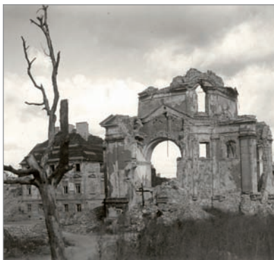
Ruiny Warszawy 1945. Rynek Nowego Miasta. Ruiny kościoła Sakramentek.