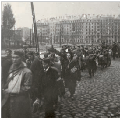
Oddziały powstańcze w drodze do niewoli, ul. Grójecka

2 września – w nocy z 1 na 2 września pociski czołgowe roztrzaskały kolumnę Zygmunta. Stare Miasto zostaje zdobyte przez hitlerowców. Walka w innych rejonach Warszawy trwała dalej.