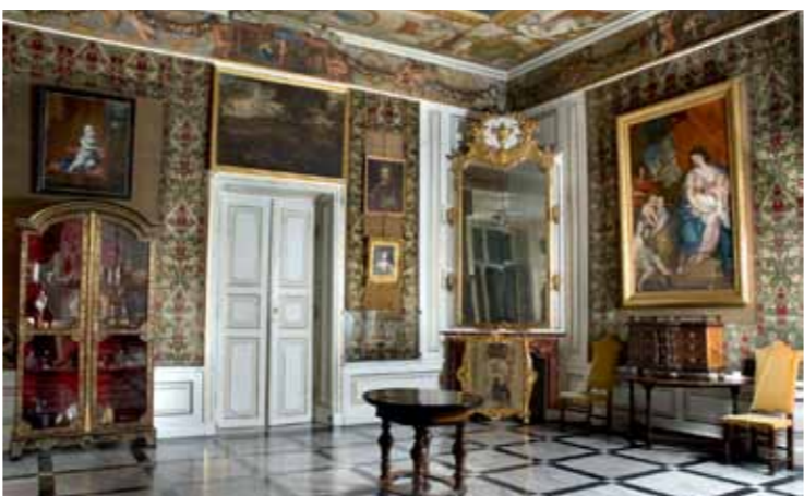
Ensemble Monumental de Palais et Parc à Wilanów ul. St. K. Potockiego 10/16, tél. 22 842 07 95, www.wilanow-palac.art.pl

Entre le palais et le lac de Wilanów un jardin italien baroque est situé sur deux niveaux. Dans la partie sud se trouve un parc romantique style anglais. Le complexe palais-parc à Wilanow est un lieu d'évènements culturels et de concerts. A la place de l'ancien manège du palais se trouve aujourd'hui le Musée de l'Affiche.