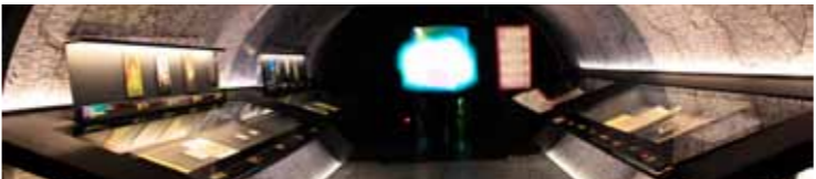
Les informations précises sur les événements pendant l'Année de Chopin 2010 www.chopin2010.pl

Au Musée il y a une possibilité d'assister à des concerts live.