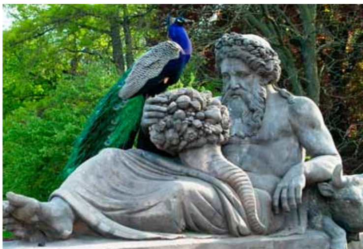
Ensemble Monumental de Palais et Parc Łazienki Królewskie ul. Agrykola 1, tél. 22 506 01 01, www.lazienki-krolewskie.pl

Le Parc Royal Łazienki est le lieu de nombreux événements culturels, scientifiques et divertissants ainsi que l'endroit préféré des promenades des habitants de Varsovie. Dans le parc il est interdit de faire du rollers, du skate et du vélo.