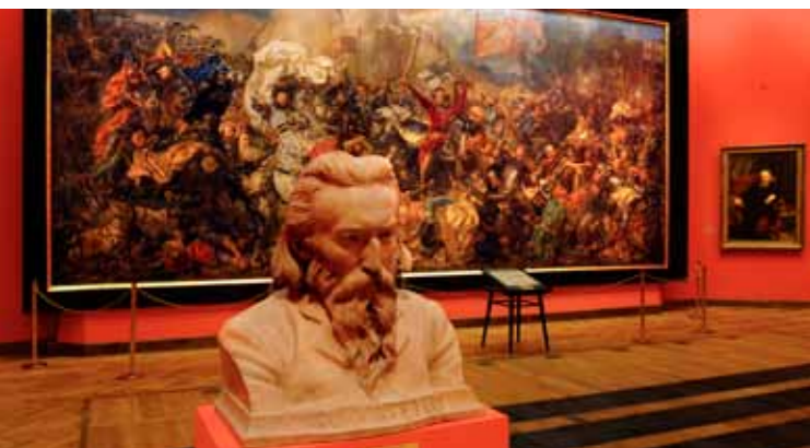
Museo Nacional, Aleje Jerozolimskie 3 tfn.: 22 629 30 93, www.mnw.art.pl . Sábado – entrada gratuita.

El ala del edificio que da al río Vístula la ocupa el Museo del Ejército Polaco , que presenta la historia de las armas polacas desde la Edad Media. En el patio de enfrente del museo se puede ver el material de guerra utilizado en la Primera y la Segunda Guerra Mundial: tanques, helicópteros y cañones.