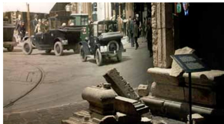
Museo de la Insurrección de Varsovia, ul. Grzybowska 79 tfn.: 22 539 79 05, www.1944.pl . Los domingos – entrada gratuita.

El museo ofrece una gran variedad de actividades educativas y culturales: organiza clases y talleres para los jóvenes a través del contacto con auténticos objetos expuestos, crea interesantes juegos educativos y ofrece conferencias, películas, conciertos y representaciones teatrales. La mayoría de eventos se celebran durante la semana del aniversario, que abarca el 1 de agosto, es decir, el día de la Insurrección.