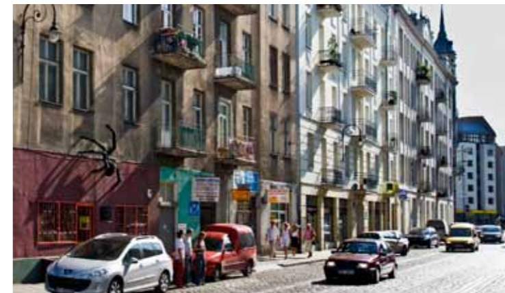
Praga ul. Ząbkowska

Koneser, donde en la actualidad se halla un moderno centro cultural, es uno de los ejemplos más importantes de arquitectura industrial.