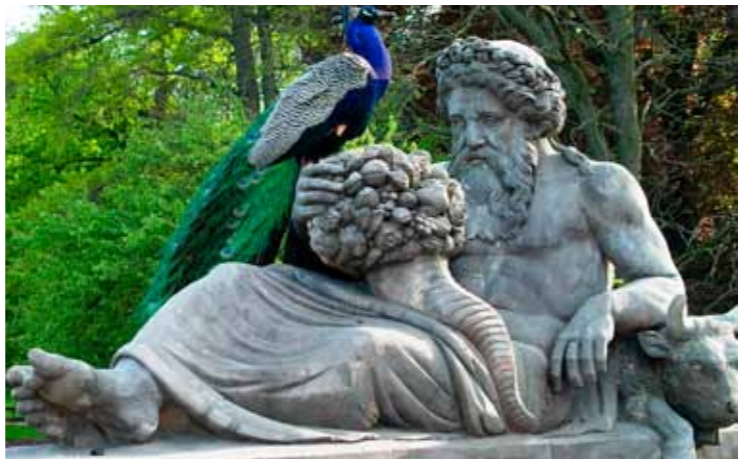
El Palacio Real y los Jardines de Łazienki ul. Agrykoli 1, tfno.: 22 506 01 01, www.lazienki-krolewskie.pl

Łazienki es uno de los conjuntos palaciegos con jardines más preciosos de Europa. Fue fundado en el siglo XVII por el rey polaco Estanislao Augusto. En tiempos pasados, en esta zona densamente arbolada se encontraba un parque zoológico, donde los reyes organizaban sesiones de caza. El curioso nombre del parque procede de los baños que fueron transformados en palacio. En el territorio de Łazienki hay numerosos edificios antiguos, entre los que destaca la residencia real de verano: Pałac na Wyspie (Palacio en la Isla), donde se celebraban fiestas y los famosos almuerzos de los jueves. Junto al palacio se encuentra el Teatr na Wyspie (Teatro en la Isla). En el parque también merece la pena visitar el Palacio Myślewicki, donde vivían los cortesanos del rey, Pomarańczarnie (Orangeries), Kordegardy (Cuerpos de Guardia) y Biały Domek (Casa Blanca). Łazienki Królewskie es sede de numerosos eventos de carácter cultural, científico y recreativo, además de ser uno de los lugares preferidos por los varsovianos para pasear. En el parque no se puede patinar ni montar en bicicleta.