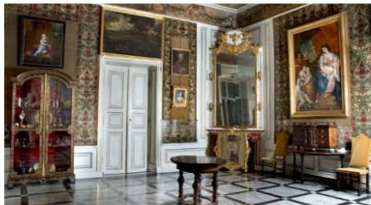
El Conjunto Palacio – Parque de Wilanów ul. St. K. Potockiego 10/16, tfno.: 22 842 07 95, www.wilanow-palac.art.pl

El Palacio de Wilanów fue la residencia real de verano de Juan III Sobieski y, más tarde, del rey Augusto II. Asimismo, perteneció a las familias nobles más distinguidas. El nombre de la residencia y de todo el territorio procede del término Villa Nova. Sobieski dio este nombre a las tierras que compró en el siglo XVII con el objetivo de construir el palacio. El impresionante edificio combina los elementos de una mansión señorial, una villa italiana con jardín y un palacio al estilo de Luis XIV, el Rey Sol francés. El palacio es uno de los monumentos más bellos del barroco europeo y da testimonio del esplendor de la República. Merece la pena mencionar que, en 1805, Stanisław Potocki (por aquel entonces el propietario de Wilanów) hizo accesible al público su colección de obras de arte, reunida en el palacio de Wilanów, surgiendo de esta manera uno de los primeros museos de Polonia. Entre el palacio y el lago de Wilanów se encuentra un jardín italiano con estilo barroco. En la parte sur se halla un parque romántico al estilo inglés. El conjunto palaciego de Wilanów es una importante sede de eventos culturales y conciertos. En lugar del antiguo picadero de palacio, se encuentra el Museo del Cartel.