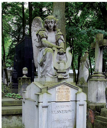
Grabmäler auf dem Powązki-Friedhof

Im Jahre 1974 wurde auf Initiative von Jerzy Waldorff – Schriftsteller und Gesellschaftsaktivist – das „Gesellschaftskomitee für den Schutz des Alten Powązki“ gegründet, welches heute nach ihm benannt ist. Alljährlich am 1. November findet auf dem Friedhof eine Spendenaktion für die Renovierung der Grabstätten statt, bei der Schauspieler, Journalisten, Sportler und Politiker Geld sammeln.