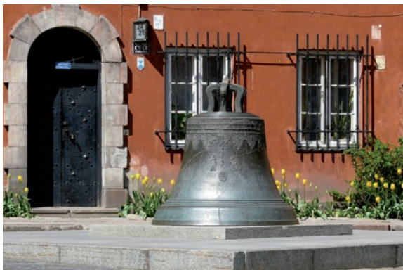
Glocke auf dem Kanonia-Platz

Auf dem Kanonia-Platz befindet sich auch eine steinerne Tafel mit dem Straßennamen - das älteste Straßenschild in Warschau.