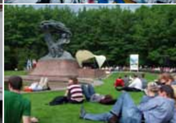
Łazienki Królewskie-Park – Denkmal von Fryderyk Chopin