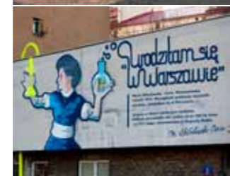
Skłodowska-Curie-Wandmalerei – ul. Lipowa