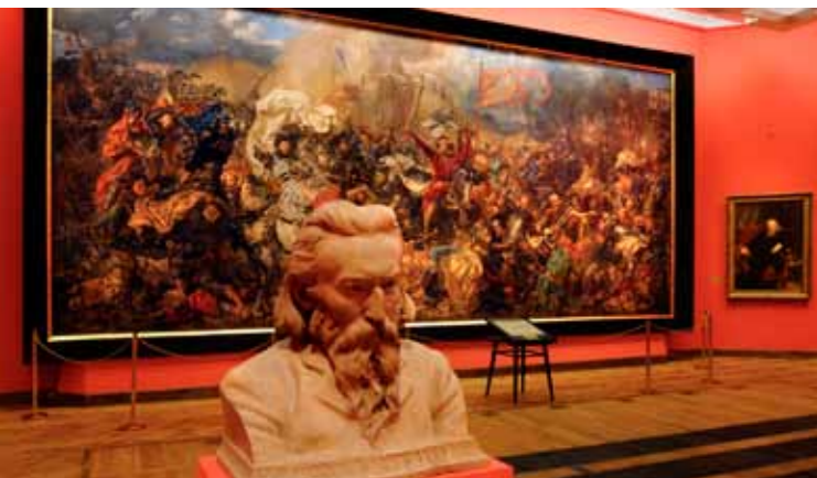
Das Nationalmuseum (Muzeum Narodowe), Aleje Jerozolimskie 3 Tel. 22 629 30 93, www.mnw.art.pl . Sa. Eintritt frei.

Das Nationalmuseum ist eine der wichtigsten Kulturinstitutionen und das grösste Museum der Hauptstadt. In sieben permanenten Galerien werden u.a. Exponate der frühchristlichen Kunst, Skulpturen, Tafelmalerei und Goldschmiedekunst aus allen Regionen, die historisch mit dem mittelalterlichen Polen verbunden sind präsentiert, aber auch Werke, die in anderen wichtigen europäischen Zentren entstanden sind, Gemälde, Schnitzereien, sowie das Kunsthandwerk ab dem Mittelalter bis zum Anfang des 20. Jahrhunderts. Eine unumstrittene Attraktion ist das riesige Gemälde des Jan Matejko (19. Jahrhundert) 'Schlacht bei Grunwald' mit den beeindruckenden Maßen: 426 cm x 987 cm. Im Museum finden zahlreiche temporäre Ausstellungen statt, die Kunst aus aller Welt präsentieren. Den Flügel des Gebäudes seitens der Weichsel, nimmt das Polnische Militärmuseum ein, in dem die Geschichte der polnischen Waffen ab der Zeit des Mittelalters in einer Ausstellung präsentiert wird. Im Hof des Museums kann man Ausrüstungen aus der Zeit der Ersten und Zweiten Weltkrieges bestaunen, unter anderem Panzer, Geschütze und Hubschrauber.