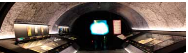
Genaue Informationen über die Ereignisse des Chopinjahres 2010 bei www.chopin2010.pl