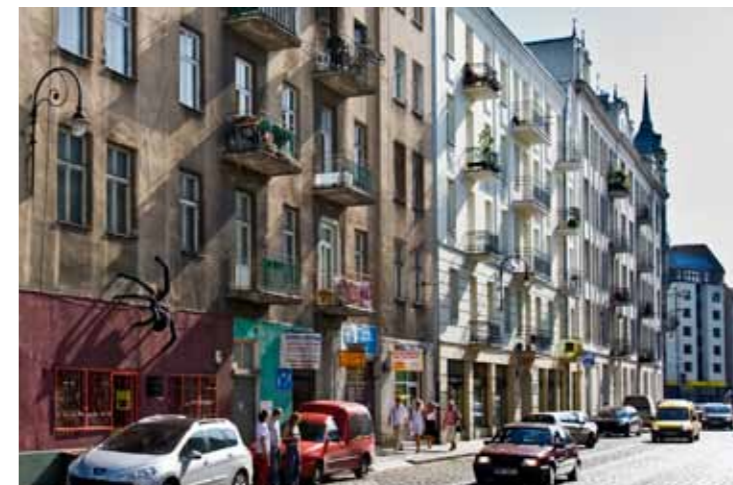
Der Stadtbezirk Praga (Praga) ul. Ząbkowska

Der Stadtbezirk Praga war über Jahrhunderte eine selbstständige Stadt. Erst Ende des 18. Jahrhunderts wurde er formell zu Warschau angeschlossen. Jahrelang stellte er einen zweitrangigen Teil der Stadt dar. Dank dessen, dass er die Kriegszerstörungen überstand, ist Praga heute ein faszinierender Stadtteil, den Künstler als Atelier, Galerien und alternative Theater wählen. Auch moderne Clubs entstanden. Aus postindustriellen Objekten wurden kulturelle Zentren, Kinos, Galerien und Pubs. Andererseits ist es genau in Praga, wo wir auf viele Strassen treffen, die ihre damaligen Bauten gänzlich erhalten konnten. Hier finden wir alte Laternen und Pflastersteine aus der Vorkriegszeit. Eine der Hauptstrassen des alten Praga ist die Ząbkowska Strasse , die für viele die 'Altstadt von Praga' ist. Hier befindet sich eine der unbestrittenen Attraktionen der Stadt, der 'Konser' - ein Gebäudekomplex aus dem Ende des 19. Jahrhundert, aus rotem Ziegel, der über 100 Jahre eine Alkoholfabrik beherbergte. Der 'Konser', in dem sich derzeit ein modernes Kulturzentrum befindet, ist eines der wertvollsten Beispiele der Industrie-Architektur.