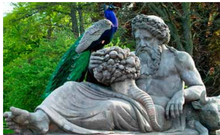
Der Łazienki-Park (Łazienki Królewskie) ul. Agrykoli 1, Tel. 22 506 01 01, www.lazienki-krolewskie.pl

Der Łazienki-Park ist eine der schönsten Palast- und Parkanlagen Europas, gegründet im 17. Jahrhundert durch den König Stanislaus August. Auf diesem dicht bewaldeten Gebiet befand sich früher ein Tiergarten – ein Ort an dem die Könige jagten. Namensgebend für den Park war ein Badepavillon, der zum Palast umgebaut wurde. Auf dem Gebiet des Łazienki-Parks befinden sich viele historische Gebäude, von denen das Wichtigste die Sommerresidenz des Königs ist – das Palais auf dem Wasser. Hier fanden viele Empfänge und die berühmten Donnerstagstreffen statt. Neben dem Palais befindet sich das Theater auf der Insel. Weiters lohnt es sich das Myslewski-Palais (Pałac Myslewicki) im Park aufzusuchen. Dieses diente als Wohnsitz der königlichen Angehörigen. Einen Besuch wert sind auch: die Orangerie (Pomarańczarnia), die Kordegarden (Kordegardy) und die Weisse Haus (Biały Domek). Der königliche Łazienki-Park ist ein Ort zahlreicher kultureller, wissenschaftlicher und unterhaltender Veranstaltungen, sowie ein beliebtes Ausflugsziel der Warschauer. Im Park ist es verboten auf Rollschuhen, Skateboards und Fahrrädern zu fahren.