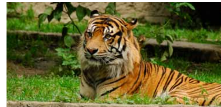
Der Zoo ul. Ratuszowa 1/3, Tel. 22 619 40 41, www.zoo.waw.pl