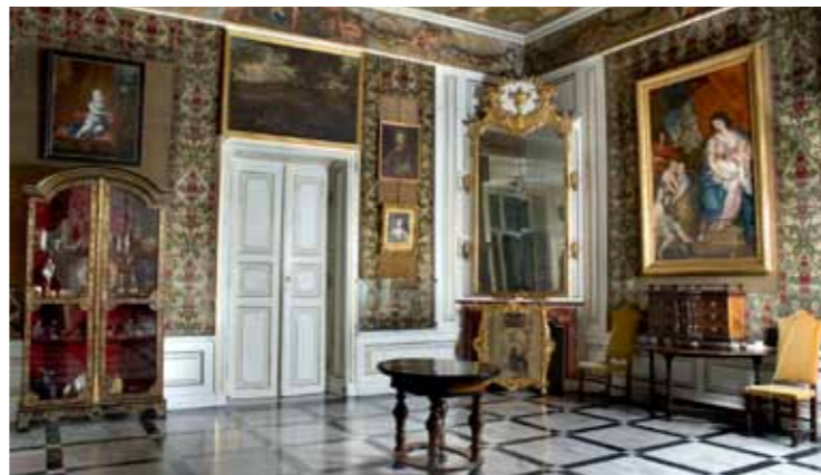
Der Palast in Wilanów (Pałac w Wilanowie) ul. St. K. Potockiego 10/16, Tel. 22 842 07 95, www.wilanow-palac.art.pl

Der Palast in Wilanów ist eine königliche Sommerresidenz von Jan III. Sobieski, und dann König August II., sowie vieler bedeutender Fürstengeschlechter. Der Name der Residenz, sowie des ganzen Stadtviertels hat seinen Ursprung in der Bezeichnung Villa Nova. König Sobieski gab diesen Namen seinen Ländern, als er sie im 17. Jahrhundert erwarb, um dort einen Palast zu erbauen. Das beeindruckende Bauwerk vereinte in sich Elemente eines adeligen Hofes, einer italienischen Gartenvilla und eines Palastes im Stil des französischen Sonnenkönigs Ludwig XIV. Der Palast gehört zu den schönsten Denkmälern des europäischen Barocks und ist ein Zeugnis des Glanzes der Republik. Erwähnenswert ist, dass Stanislaus Potocki, (damaliger Besitzer von Wilanów) im Jahre 1805, seine im Palast von Wilanów angesammelte Kunstsammlung der Öffentlichkeit zugänglich machte, womit er eines der ersten Museen in Polen erschuf. Zwischen dem Palast und dem Wilanów-See befindet sich auf zwei Ebenen ein barocker italienischer Garten. Im südlichen Teil ist ein romantischer Park im englischen Stil. Das Schloss und der Park in Wilanów bilden einen bedeutenden Ort für kulturelle Ereignisse und Konzerte. Anstelle der ehemaligen Palast-Reitschule befindet sich gegenwärtig das Plakatmuseum.