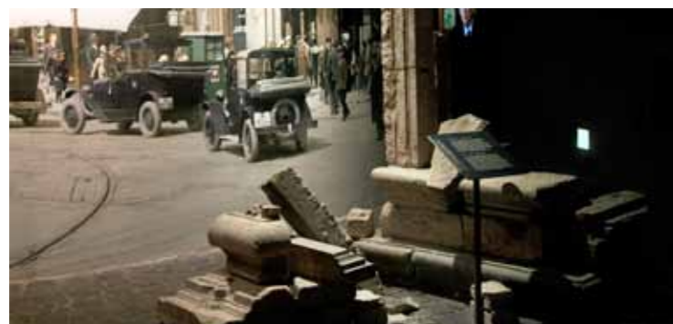
Das Museum des Warschauer Aufstandes (Muzeum Powstania Warszawskiego) ul. Grzybowska 79, Tel. 22 539 79 05, www.1944.pl . So. Eintritt frei.

Es befindet sich im Gebäude des ehemaligen Strassenbahn-Elektrizitätswerkes, in der Grzybowska Strasse 79. Ausser dem Hauptgebäude, umfasst es den Park der Freiheit (Park Wolności), die Gedenkmauer (Mur Pamięci) und den Bunker (Bunkier). Bis zur Eröffnung des Chopin-Museums war es das modernste Museum von Warschau. Die Ausstellung gibt die Atmosphäre des aufständischen Warschauer wieder. Es zeigt nicht nur die militärischen Chroniken von 63 Tagen Kampf, sondern auch das tägliche Leben der Zivilbevölkerung. Eine der unzähligen Attraktionen des Museums ist eine Reproduktion des Bombers Liberator B-24 J. Das Museum führt verschiedenartige Aktivitäten auf dem Gebiet der Bildung und Kultur, es organisiert Werkstätten und Unterricht für Jugendliche in Anlehnung an authentische Ausstellungsstücke, es entwickelt interessante didaktische Spiele und lädt zu Vorträgen, Filmen, Konzerten und Theateraufführungen ein. Die meisten Aktivitäten gibt es in der sogenannten Jahrestags-Woche um den 1. August, dem Tag des Ausbruchs des Warschauer Aufstandes.