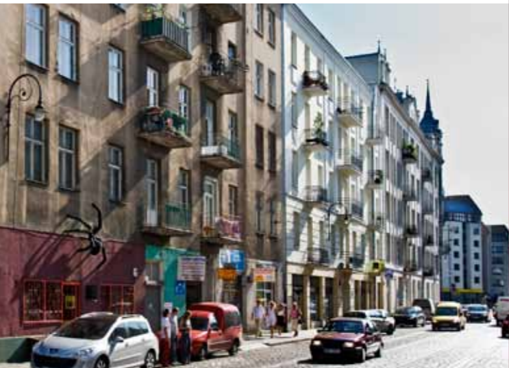
华沙布拉格区 (Dzielnica Praga) ul. Żąbkowska

布拉格区最重要的街道是宗贝考夫斯卡路 (ulica Żąbkowska)，很多人认为这是该区的“古城”。在此路旁，有华沙最有意思的地方之一：十九世纪“克内赛尔”酒厂 (“Koneser”) 的红砖厂房的组合，最珍贵的古老工业建筑之一，目前，里面是现代化的文化中心。