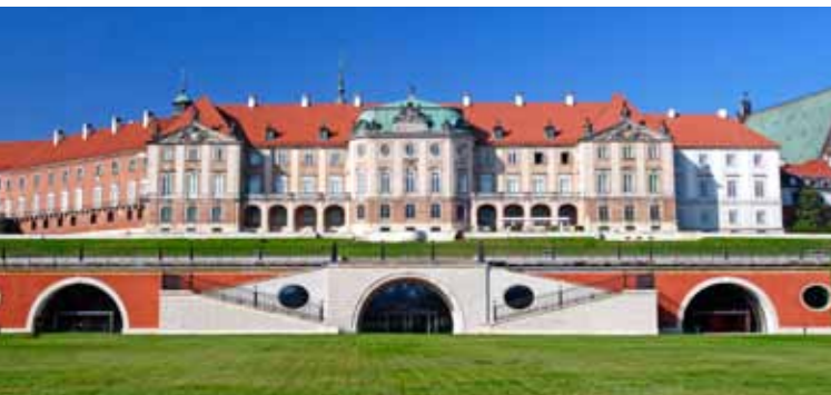
王宫 (Zamek Królewski) Plac Zamkowy 4, tel. 22 35 55 170, www.zamek-krolewski.com.pl

在王宫前，有齐格蒙特三世·瓦萨王的圆柱 (Kolumna Króla Zygmunta III Wazy)——华沙最古老的非宗教性纪念像，1644年由瓦迪斯瓦夫四世王 (król Władysław IV) 为纪念其父，将宫廷迁到华沙的齐格蒙特三世而立起。此纪念柱的总高度22米，国王的塑像有275厘米。齐格蒙特三世右手持着代表勇气的佩剑，左手扶着十字架，表明他一向愿意打击邪恶。根据传说，如果国王放下佩剑，华沙将面临失败。