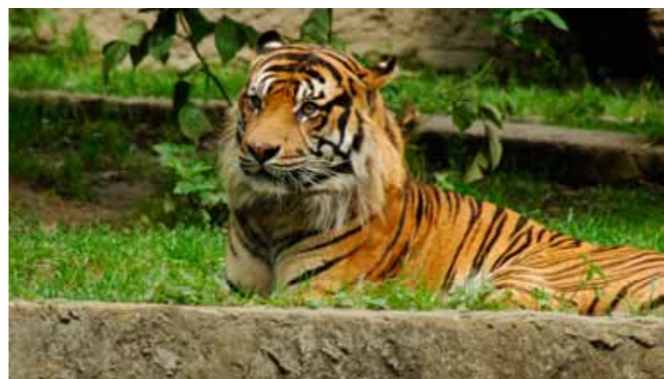
动物园 (Zoo) ul. Ratuszowa 1/3, tel. 22 619 40 41, www.zoo.waw.pl

在动物园中部，有特别为少年儿童布置的“神奇的动物园”——孩子既可以触摸里面的动物，也可以给动物喂胡萝卜或者苹果。旁边则有现代的，安全的游乐场。