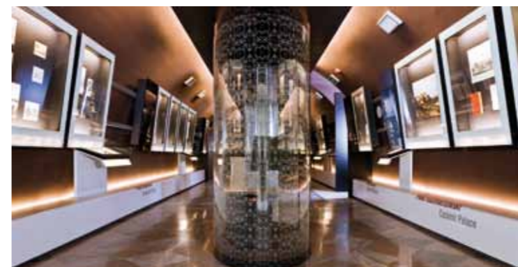
有关肖邦年活动的详细信息，请登陆： www.chopin2010.pl

作为音乐城和肖邦之城的华沙最具代表性的地方就是弗里德里克·肖邦博物馆，欧洲最现代化的生平博物馆，世界上与肖邦有关的藏品最多的地方。博物馆位于古老的奥斯特罗格斯基家族宫殿 (Pałac Ostrojskich)，馆内有乐谱的真迹和印刷品、信函、肖邦的亲笔签名、笔记和曾属于他的物品，如钢琴、衬衫胸部的夹子、日历本等等。特别宝贵的展品是肖邦死后脸部的石膏模具遗迹和手的铸模。参观者不必按固定的路线参观。因为门票上有集成电路芯片，所以每个人可以随自己的兴趣选择参观路线。触控屏幕、有声装置和通过气味识别装置等多媒体设备使人通过所有的五官了解该馆所介绍的内容。在馆内可以欣赏现场音乐会。