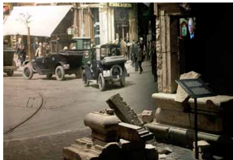
华沙起义博物馆 (Muzeum Powstania Warszawskiego), ul. Grzybowska 79 tel. 22 539 79 05, www.1944.pl. 周日免费参观。

华沙起义博物馆从事多种教学文化活动：举办青年接触真实展品的课程和讲习班，组织教育性的有趣的游戏，举办讲座、音乐会和戏剧演出，播放电影。在八月一日起义爆发纪念日前后一周内，各种活动最多。