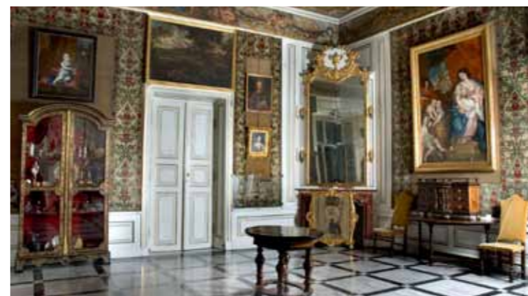
维拉诺夫宫 (Zespół pałacowo-parkowy w Wilanowie) ul. St. K. Potockiego 10/16, tel. 22 842 07 95, www.wilanow-palac.art.pl