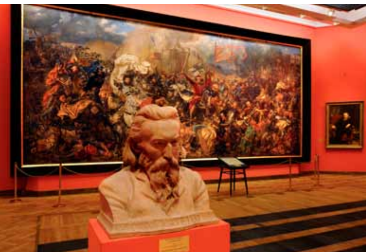
国家博物馆 (Muzeum Narodowe), Aleje Jerozolimskie 3 tel. 22 629 30 93, www.mnw.art.pl. 周六免费参观。

该楼靠维斯瓦河的部分属于波兰军事博物馆，介绍波兰从中世纪至今的武装力量的历史。波兰军事博物馆前院内，有第一次世界大战和第二次世界大战时期的军用设备：坦克、大炮、飞机等等。