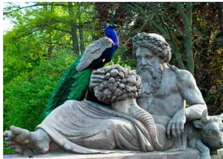
瓦津基公园 (Zespół pałacowo-ogrodowy Łazienki Królewskie) ul. Agrykoli 1, tel. 22 506 01 01, www.lazienki-krolewskie.pl

瓦津基公园是华沙举办众多文化、科学和娱乐活动的地方，也是华沙人最喜爱的散步之地。公园里，不允许滑旱冰、滑板，也不可以骑自行车。